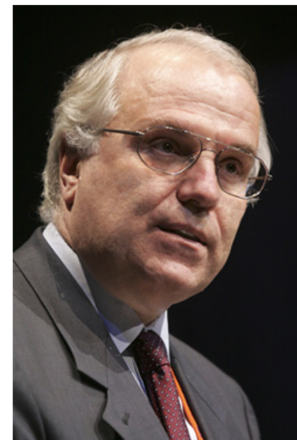
Fabio Colasanti bivši glavni direktor DG INFSO

The revised EU framework will thus better meet the future challenges arising from a rapidly evolving sector. Its timely implementation is essential and will ultimately benefit the European economy and society by providing it with the advanced electronic communications infrastructure it needs for its growth.”